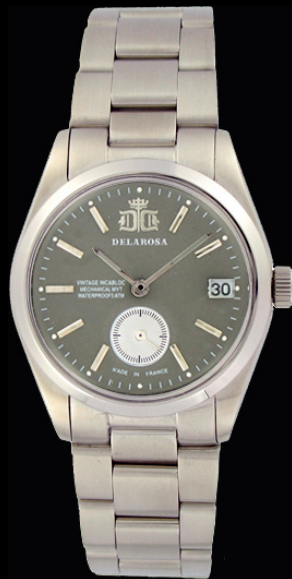
AM 2009 Gr/Smatt