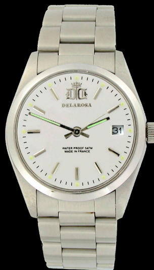
EA 2009 w /Smatt