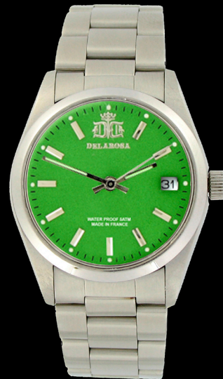
HA 2009 Gr /Smatt