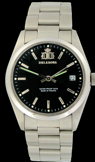
HA 2009 B1 /Smatt