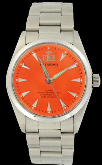
CA 2009 O / Smatt