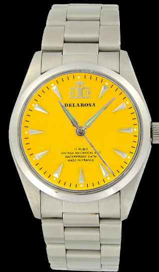
CA 2009 Y / Smatt