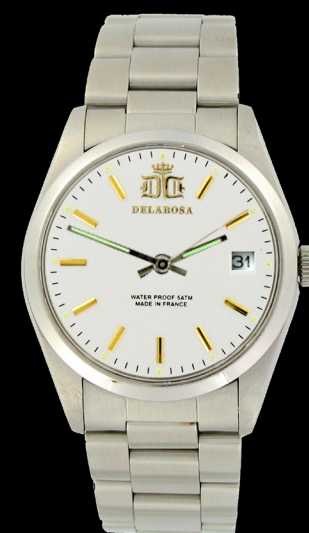
EA 2009 c /Smatt