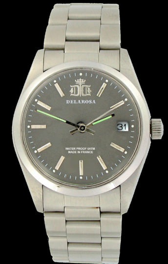
HA 2009 G /Smatt