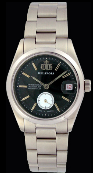
AM 2009 B/Smatt