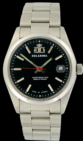
EA 2009 Br/Smatt