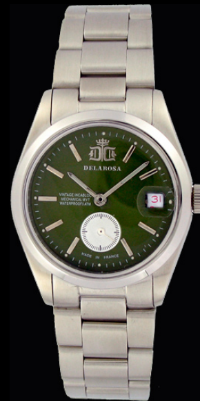
AM 2009 K/Smatt