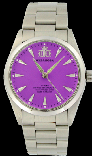
CA 2009 P / Smatt